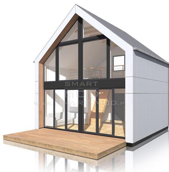
APARTAMENT 35 D

W naszej ofercie posiadamy 2 wersje domu bez pozwolenia z antresolą. Są to obecnie największe domy w naszej ofercie, jakie można postawić bez pozwolenia na budowę. Obie wersje domów mają: