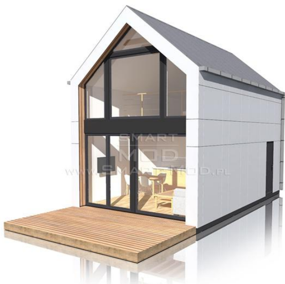
APARTAMENT 35 C